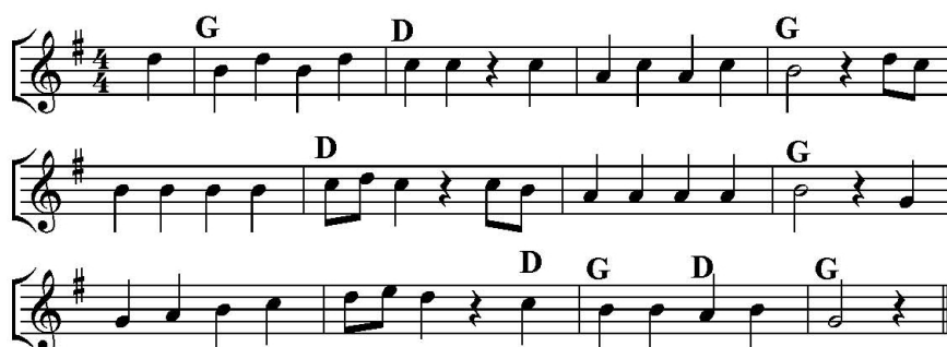
Rys. 4. Melodie wykorzystywane podczas zajęć

Na zakończenie 12-tygodniowego cyklu zajęć dzieci – członkowie orkiestry smyczkowej – opanowały: