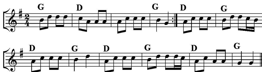
Rys. 3. Melodie wykorzystywane podczas zajęć